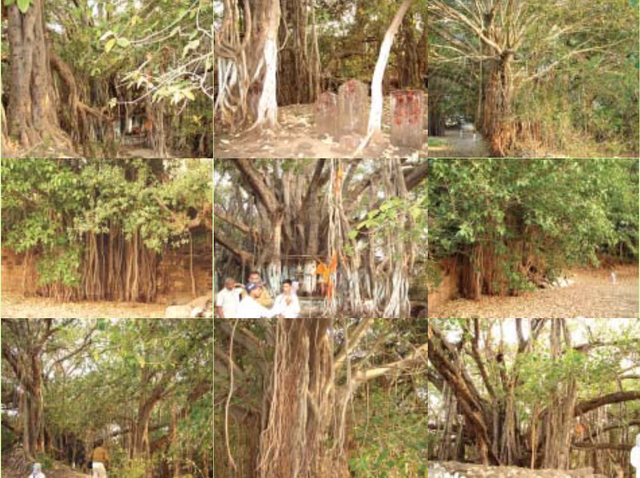
एक वृक्ष का जंगल (विभिन्न दिशाओं से लिए गए चित्र)

गांव के कुछ स्थानीय युवकों ने इस वृक्ष को बचाने की कोशिश आरम्भ कर गांव के लोगों के इस प्राकृतिक धरोहर के प्रति जागरूक