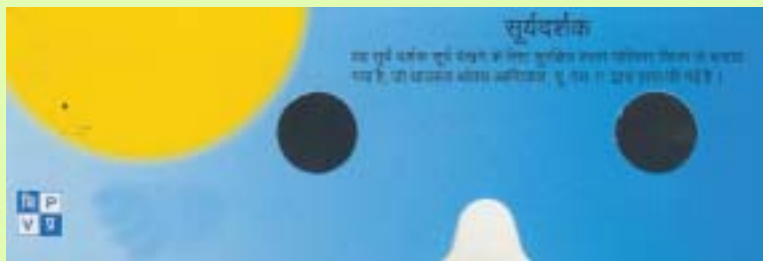
सूर्य ग्रहण को देखने के लिए विज्ञान प्रसार द्वारा विकसित किया गया सौलर फिल्टर

यह भी रोचक बात है कि पृथ्वी पर तो हीलियम की खोज सन् 1895 में हुई। इसके अलावा 29 मई 1919 के पूर्ण सूर्य-ग्रहण के दौरान एक दूरस्थ तारे से आने वाले प्रकाश का सूर्य के गुरुत्वीय क्षेत्र के कारण हुए विचलन के आधार पर पहली बार आइंस्टाइन के आपेक्षिकता के व्यापक सिद्धांत का परीक्षण किया गया। तो आप समझ सकते हैं क्यों महत्वपूर्ण है ये पूर्ण सूर्य ग्रहण।