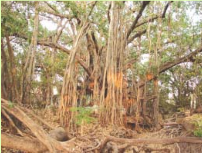
बड़ वृक्ष के घने स्तंभ मूल